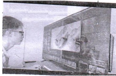
टेलीविजन का उपयोग एक कम्प्यूटर मॉनीटर के रूप में