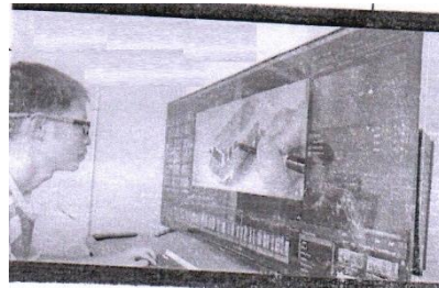
Use of Television as a Computer Monitor