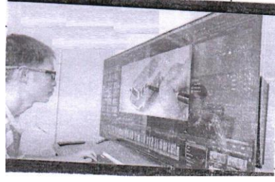
टेलीविजन का उपयोग एक कम्प्यूटर मॉनीटर के रूप में