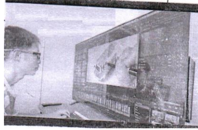
Use of Television as a Computer Monitor