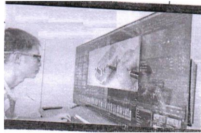
टेलीविजन का उपयोग एक कम्प्यूटर मॉनीटर के रूप में