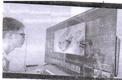
Use of Television as a Computer Monitor